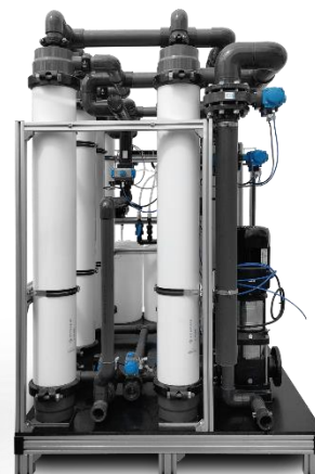
Imagem meramente exemplificativa