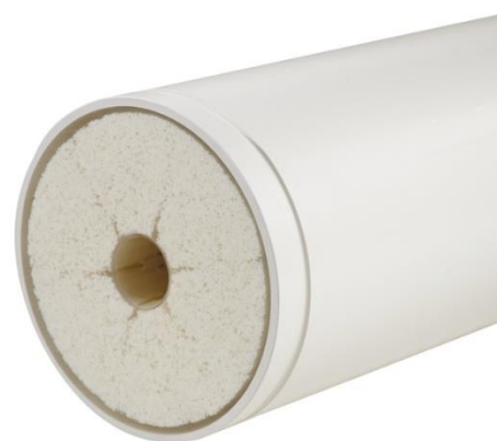
Imagem meramente exemplificativa