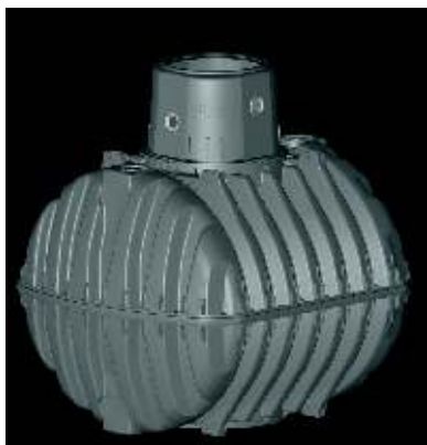
Tanque em PEAD Gama 2.700 a 26.000l

No caso de se esgotar a água do tanque, o controlo conectará automaticamente a água da rede. Ao estar protegida no sub-solo contra os efeitos da luz e do calor, a água armazenada conserva-se em perfeitas condições.